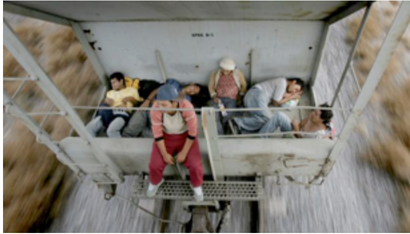
Migrantes en Nuevo Laredo, México, intentan llegar a EE UU.

Las autoridades de EE UU aseguran que desde el pasado mes de octubre, más de 52.000 personas, en su mayoría menores que no viajan acompañados de un adulto, han llegado hasta su frontera con México. La cifra supera con creces los 24.000 interceptados en los 12 meses anteriores y ha desbordado todas las previsiones del Gobierno federal.